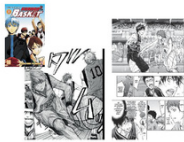
Kuroko's Basket Par Tadatoshi Fujimaki, éditeur Kyouo

Comment entrer à la Hero Academia, la meilleure école pour former des super-héros, quand on n'a aucun pouvoir ?