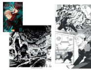
Jujutsu Kaisen Par Gege Akutami, éditeur Kyouo

Kuroko a la faculté de faire oublier sa présence où qu'il soit, en détournant l'attention des autres. Découvrez comment cette capacité va en faire un redoutable joueur de basket !