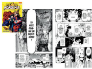
My Hero Academia Par Kohei Horikoshi, éditeur Kyouo

Quoique les mangas « Shōnen » s'adressent principalement aux adolescents, ils sont tout autant appréciés par les filles. Le fil conducteur de ces séries est principalement le parcours initiatique d'un jeune héros, souvent orphelin, naïf et volontaire, dans une quête où il gagnera en maturité en combattant pour le bien, passant de l'enfance à l'adolescence. Les plus connus sont Dragon Ball, One Piece et Naruto.